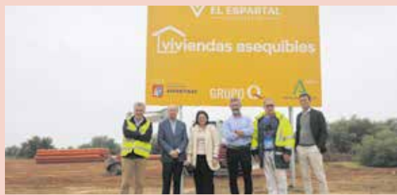
El 26 de mayo se celebrará el sorteo de las 93 VPO de Espartinas