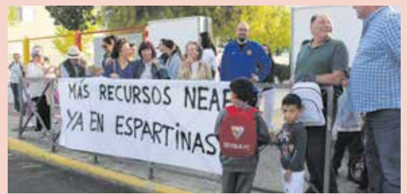
Las AMPAS siguen reclamando medios para el alumnado con necesidades especiales