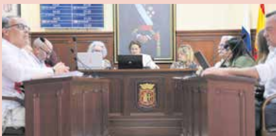
Aprobado el presupuesto municipal para 2026 con 14,6 millones de euros